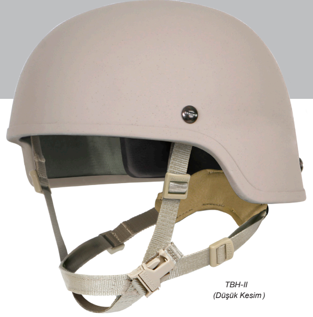
TBH-II (Düşük Kesim)

V50 - Belirtilen tehdit ve hızın zamanın% 50'sine nüfuz edeceği ve zamanın % 50'sini durduracağı kask örneğinin temel testi.